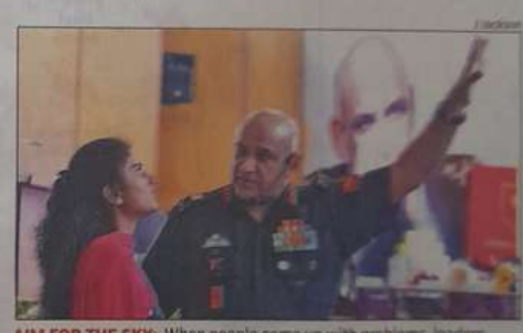
AIM FOR THE SKY: When people co should offer solutions, lieutenant general A Arun told stud Ramakrishna College of Arts and Science on Thursday

"All of you have the same amount of brain. The most in-telligent human beings are using only 5% of their brain. Students should use at least 3% of their brain to reach the ir goals. But they should un-derstand that without 100% effort, they cannot achieve anything," Arun told the stu-